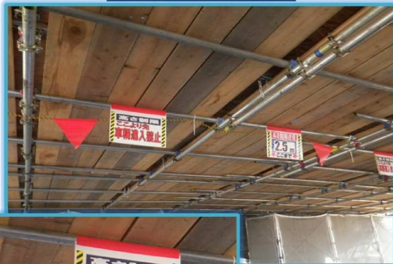
エリア別高さ制限明示-1