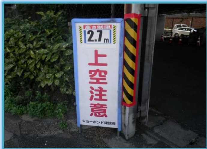
ドライバーからの視認性向上-1