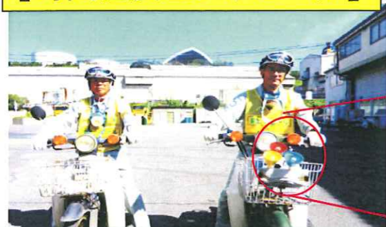
自作の「ご安全に」の鐘