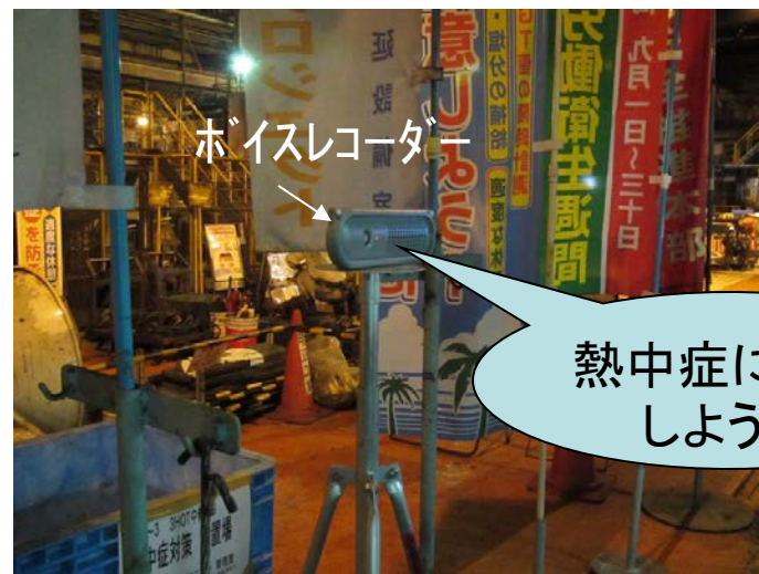
工事現場にボイスレコーダーを設置し 愛の声掛け実施