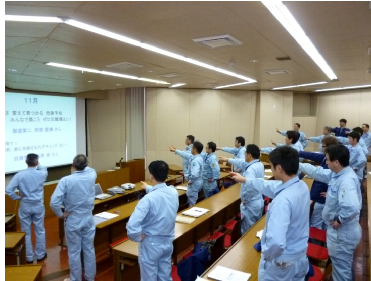
優秀標語を活用した安全衛生委員会開始・終了時の指差し唱和